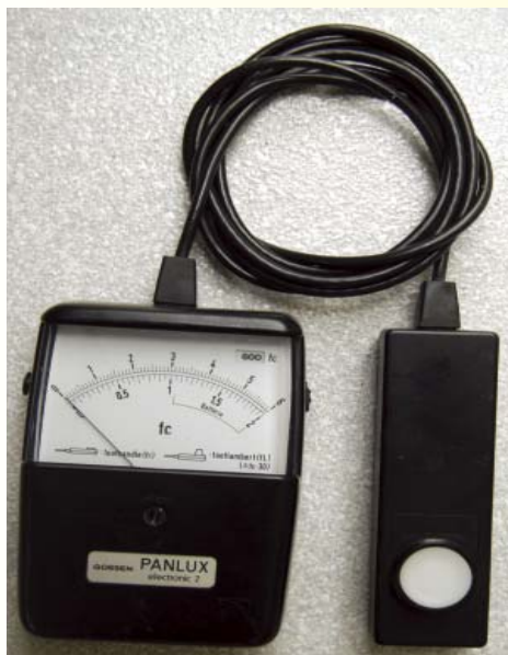
Pur misurando la luce in candele/metro anziché in PAR, questo semplice esposimetro riesce a dare un'idea precisa della distribuzione luminosa.

La tonalità luminosa può inoltre essere espressa in gradi Kelvin, questa unità di misura esprime esattamente il colore emesso dalla lampada. Le lampade migliori per coltivare la marijuana hanno una temperatura compresa fra i 3000 e i 6500 Kelvin. L'area dello spettro PAR in figura indica come le piante usano delle porzioni specifiche dello spettro nella gamma compresa tra i blu e i rossi. Usando sorgenti artificiali con spettro di emissione simile a quello delle lampade di cui è noto il valore PAR, se ne può stabilire approssimativamente il valore PAR valutandone la temperatura del colore espressa in Kelvin. Lo spettro di colore necessario alla pianta risulta la combinazione di colori diversi. Le lampade HID (high intensity discharge), o lampade a scarica ad alta intensità offrono uno