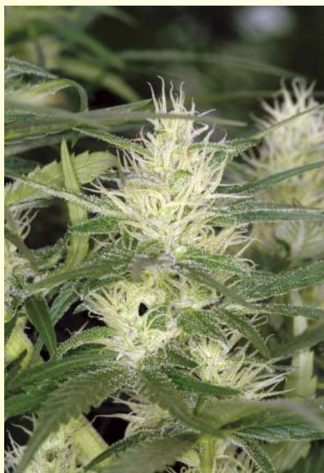
Jack Herer termina de mediados a finales de septiembre.