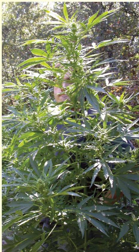
El cultivador está atisbando a través de una de sus plantas de guerrilla.