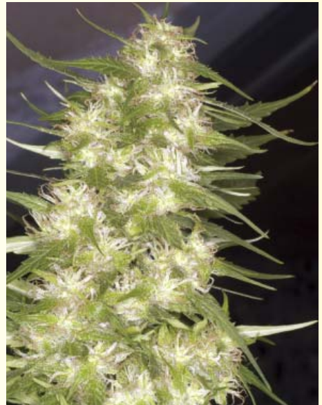
Las variedades de cannabis maduran a diferente ritmo. Elige las variedades que se desarrollen bien en tu clima y que estén en su punto antes de que comiencen los días fríos y húmedos.

Es buena idea cultivar diversas variedades con tiempos de acabado diferentes para diseminar el trabajo y el secado a lo largo del tiempo. Si llevas a cabo un cultivo de primavera, puedes cosechar durante gran parte de la temporada.