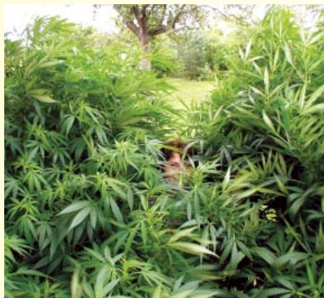
¡Te cogí! Esta hermosa Jamaican Pearl se plantó en una esquina recóndita del jardín trasero.