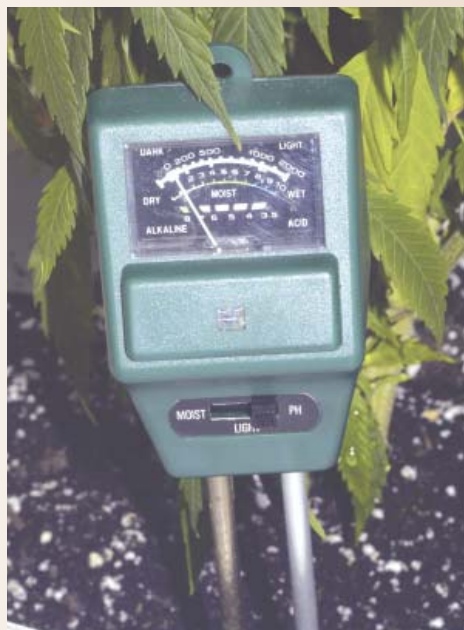
Hay medidores electrónicos de pH que, además de económicos, son fáciles de usar.

El pH puede medirse con un kit para muestras de tierra, con papel tornasol o con un medidor electrónico de pH; todos ellos se encuentran fácilmente en viveros y tiendas especializadas. Al medir el pH, toma dos o tres muestras y sigue las instrucciones del fabricante. Los kits para medir el pH de la tierra también miden el contenido general de nutrientes al mezclar la tierra con una solución química y comparar el color de la solución con una tabla de referencia. Para los jardineros principiantes, resulta difícil obtener mediciones ajustadas con cualquiera de los kits de este tipo que he visto o utilizado. Comparar el color de la mezcla tierra/reactivo y el color de la tabla suele resultar confuso. Si utilizas estos kits, asegúrate de comprar uno que incluya unas buenas instrucciones, fáciles de entender, y preguntale al dependiente por las recomendaciones exactas de uso.